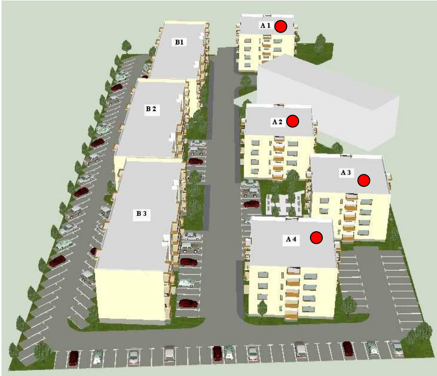
Pozitionare imobile Ansamblul Rezidential " Dumbrava"